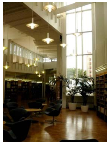
(写真は上から Pasila, Itäkeskus, Itäkeskus, Vailla)