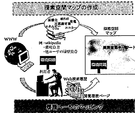
図1 提案手法の概要

本研究では、探索範囲となる話題全体をキーワードの意味的關係を距離とした二次元空間に展開する「探索空間マップ」を作成し、そのマップ上にユーザが閲覧したページをマッピングしていく、可視化手法を提案する。提案法の流れを図1に示す。提案法は、その処理を大きく分けて2段階からなる。Iでは探索課題に対応する話題空間を構成する文書を解析し、SOMを用いてキーワードを意味的な關係性を距離で表した2次元の平面に表現する。IIでは作成した探索空間マップへユーザの閲覧履歴ページを探索空間マップのベクトルとキーワードベクトルのユークリッド距離を比較することで距離の近い場所へマッピングする。以下この手順に従って、各処理を説明する。