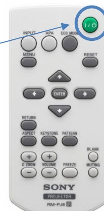
プロジェタの リモコン