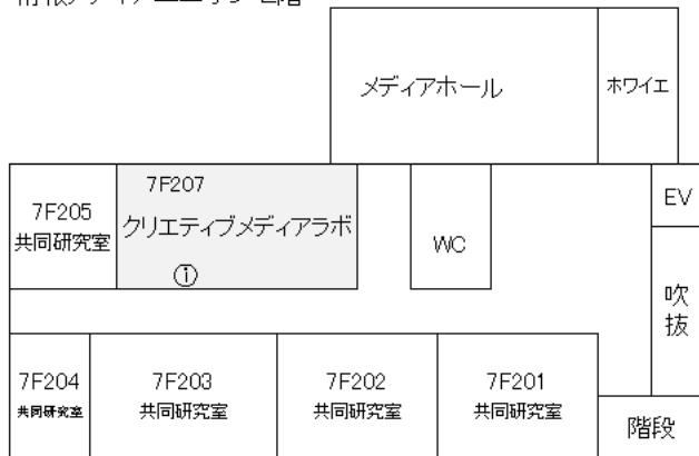
図 クリエイティブメディアラボ配置図 (情報メディアユニオン 2階)